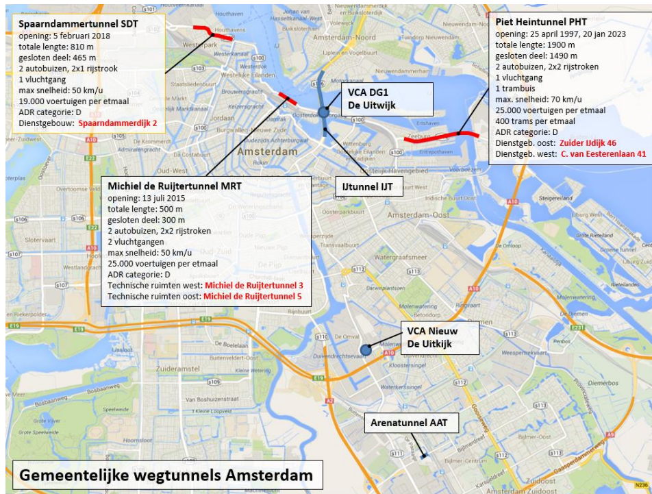
Figuur 1: Wegtunnels Amsterdam

De locaties van deze wegtunnels zijn weergegeven in figuur 1.